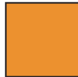
Pantone 152 C 0 - M 0 - Y 50 - K 100