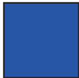
Pantone 2728 C 100 - M 70 - Y 0 - K 0