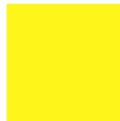
Pantone Process Yellow C 0 - M 0 - Y 100 - K 0