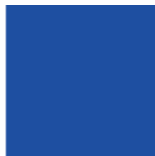
Pantone Reflex Blue C 100 - M 80 - Y 0 - K 0