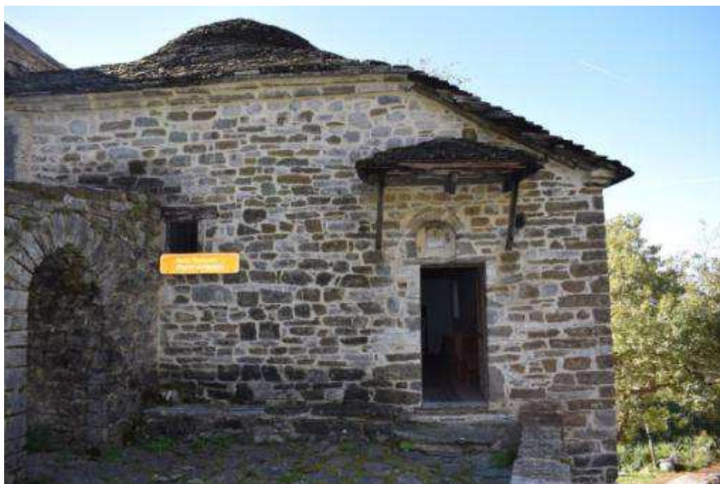
Εικόνα 1 Άποψη βόρειας όψης