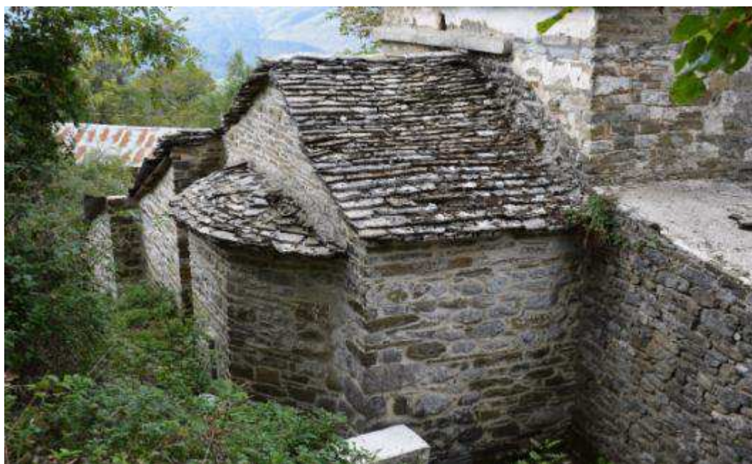
Εικόνα 7 Άποψη Ανατολικής όψης