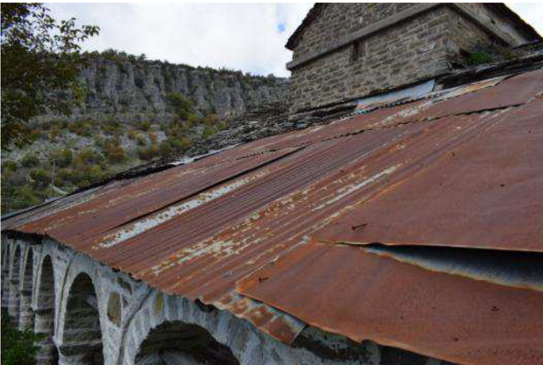
Εικόνα 10 Άποψη στέγης (λαμαρίνες με εμφανέστατα τα σημάδια της οξείδωσης)