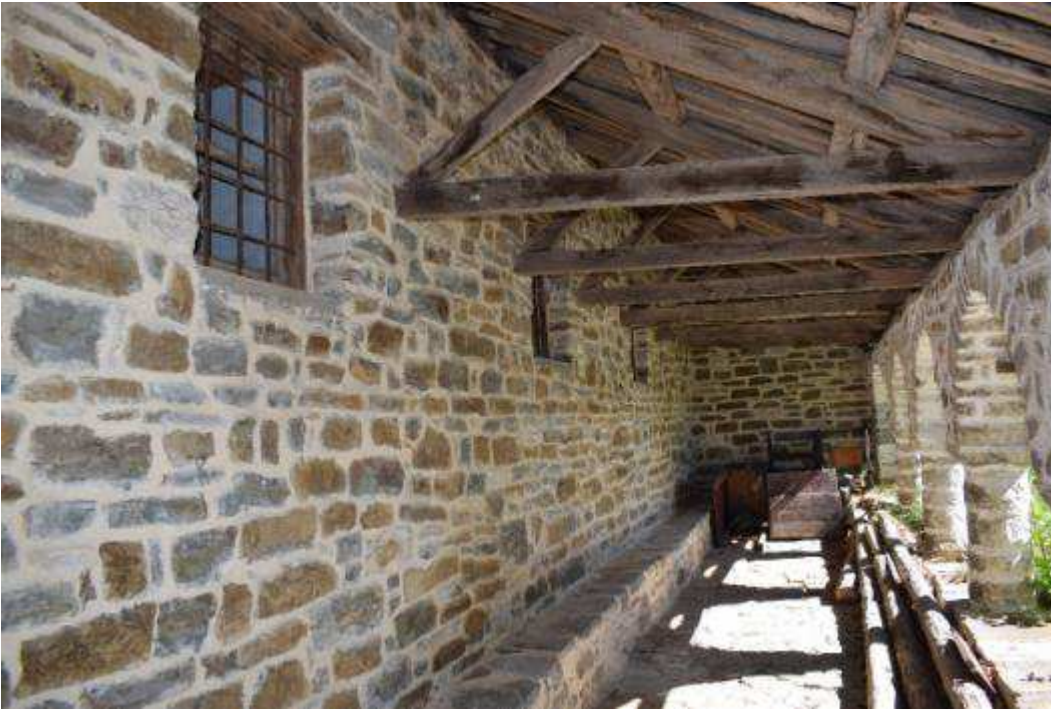
Εικόνα 11 Αποψη χαγιάτιου εσωτερικά