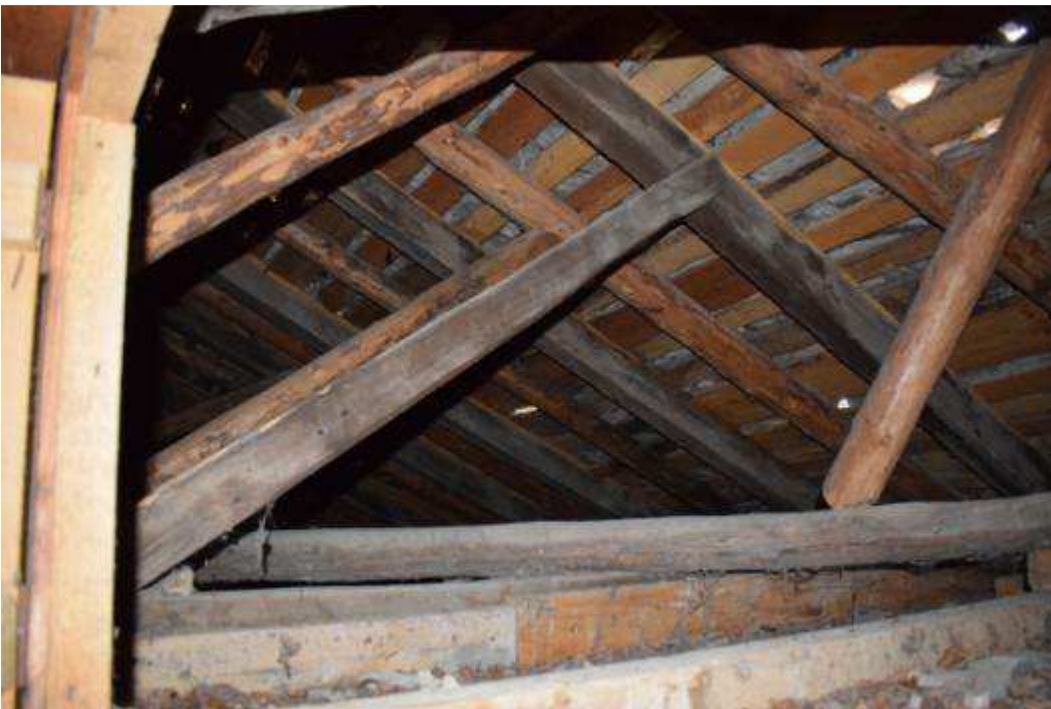
Εικόνα 12 Αποψη στέγης στοάς εσωτερικά