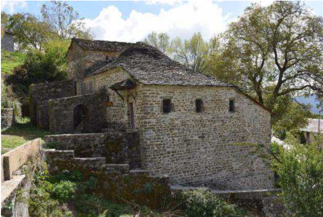
Εικόνα 3 Άποψη δυτικής όψης