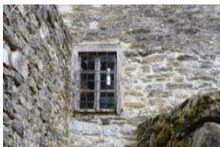
Εικόνα 14 Αποψη κουφωμάτων (κακή κατάσταση διατήρησης)