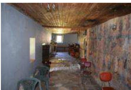
Εικόνα 15 Άποψη του εσωτερικού του ναού (εμφανείς οι ρωγμές των θόλων από τις μετατοπίσεις λόγω απουσίας ελκυστήρων και οι υγρασίες των ταβανιών από την κακή κατάσταση της στέγης)