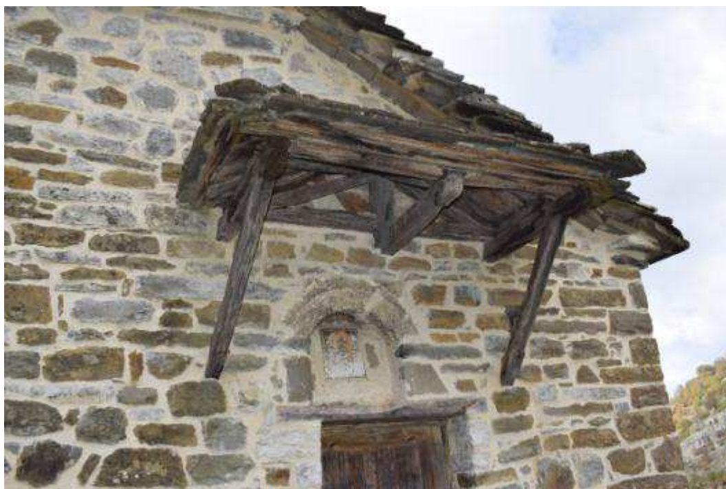
Εικόνα 13 Αποψη στεγάστρου βόρειας εισόδου