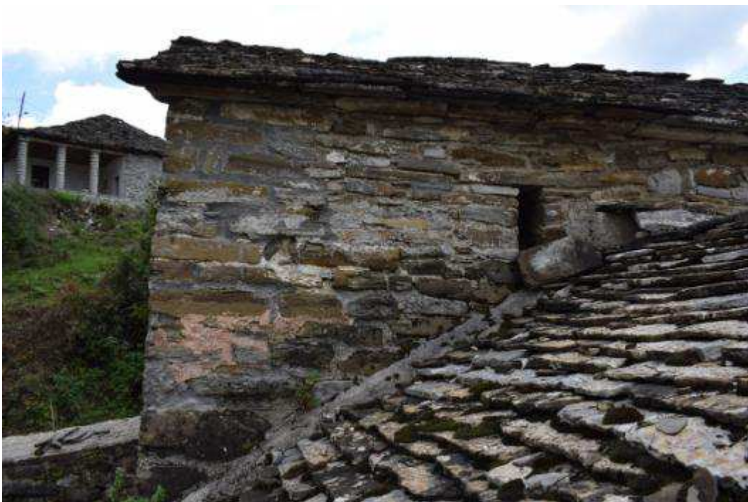
Εικόνα 4 Άποψη δυτικής όψης