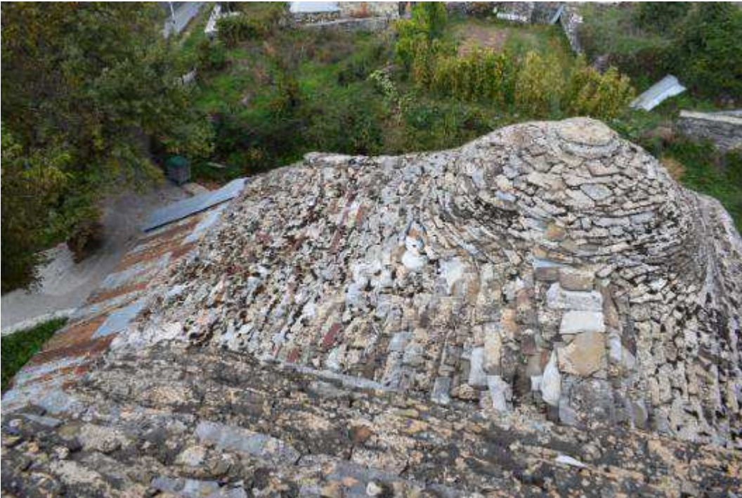
Εικόνα 9 Άποψη στέγης (φθαρμένη επικάλυψη λόγω της γήρανσης του υλικού)