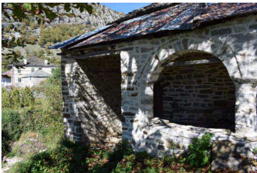
Εικόνα 6 Άποψη νότιας όψης