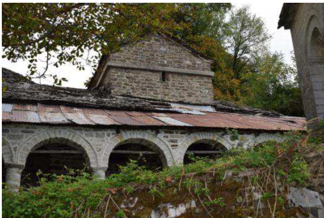
Εικόνα 5 Άποψη νότιας όψης