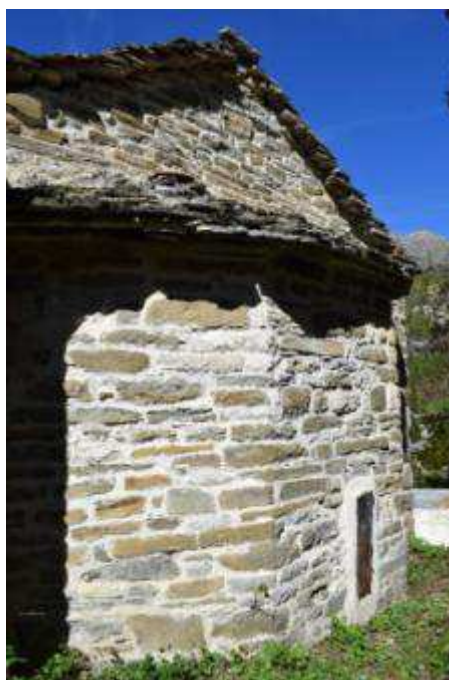
Εικόνα 8 Άποψη Ανατολικής όψης