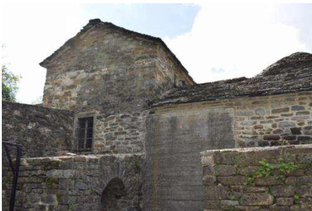
Εικόνα 2 Άποψη βόρειας όψης