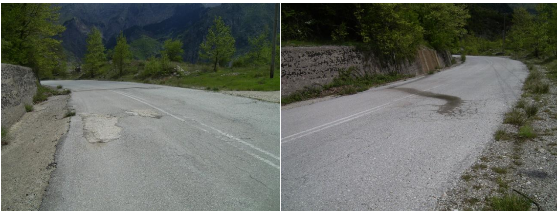
Εξυγίανση σε μήκος L=50\text{m} χ βάθος h=0.70\text{m} χ πλάτος d=7.00\text{m} .

6. X= 263829\& \Psi= 4362549 - χθ 5 +100