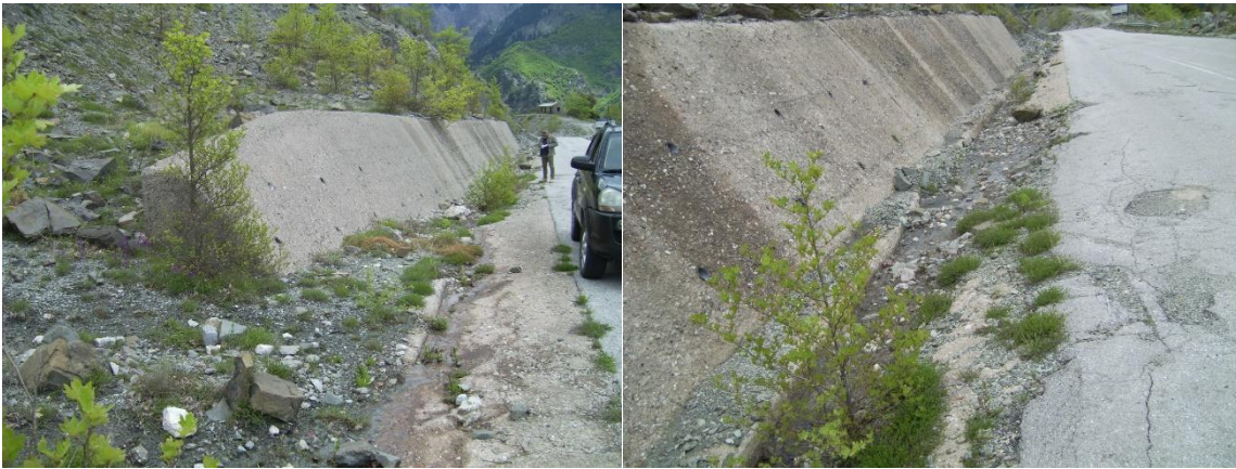
Κατασκευή επένδυσης από beton h=0.15\text{m} στο πόδι του εφιστάμενου τοίχου βαρύτητας d=2.00\text{m} σε μήκος L=30\text{m}