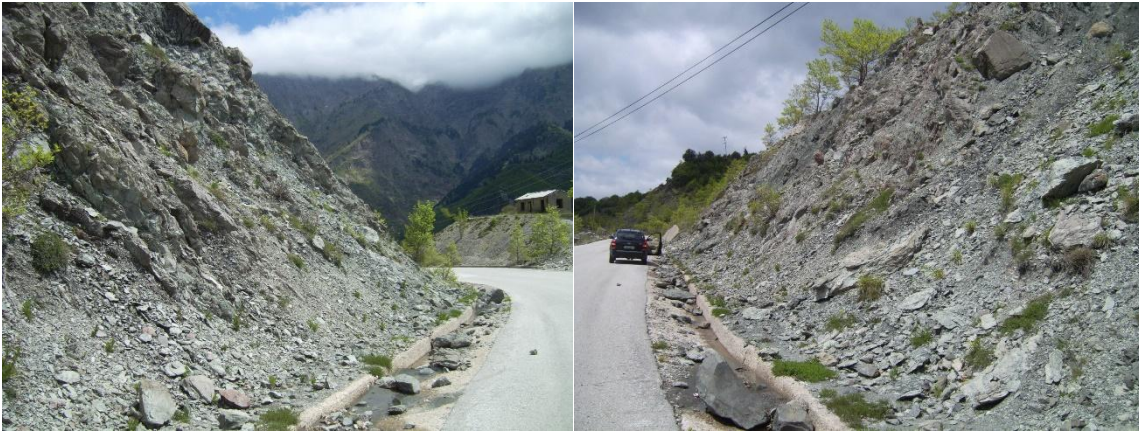
Κατασκευή σαρζανέτ (αντι βραχοπαγίδας beton) μήκος 100m και ύψους 1m.