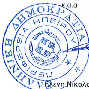
Ελένη Νικολού Πολιτικός Μηχανικός