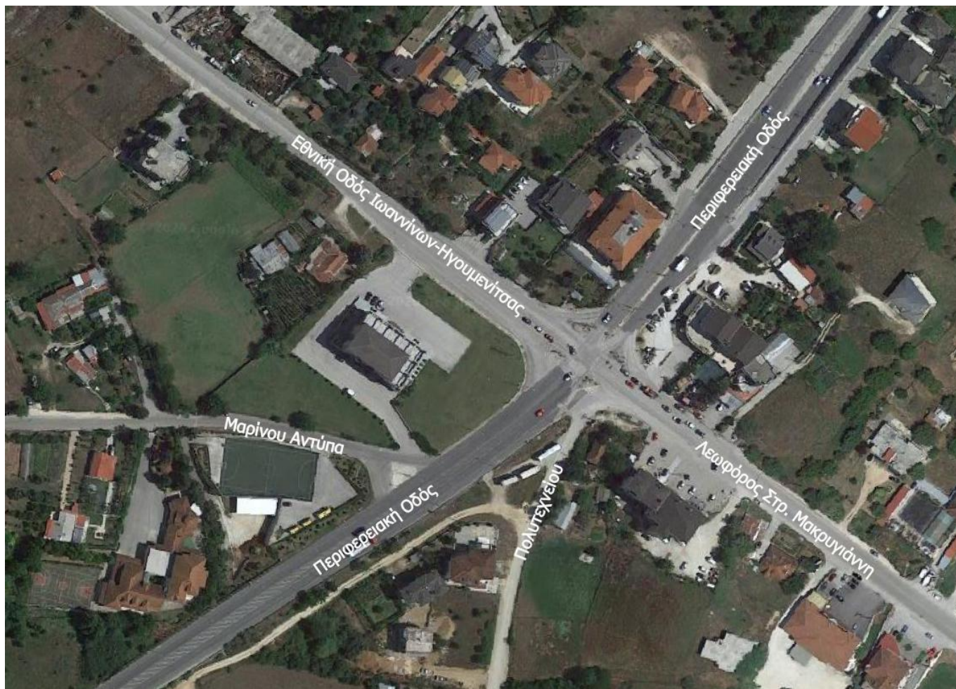
Εικόνα 1: Οδικό δίκτυο στην περιοχή του έργου