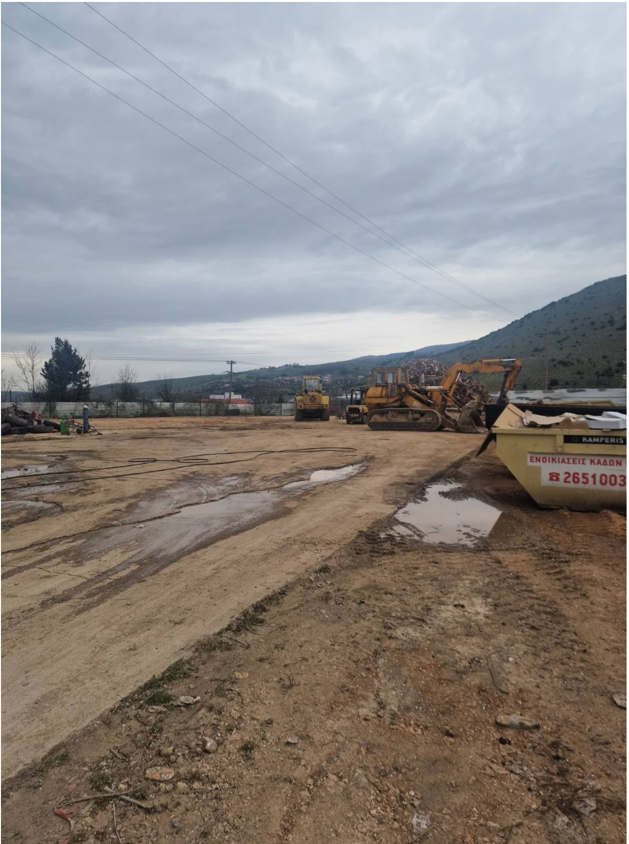
Φωτογραφία 1 & 2: Αποτύπωση εδάφους απόθεσης υλικών κατά τον καθαρισμό και την βελτίωσή του με σκυρόδεμα