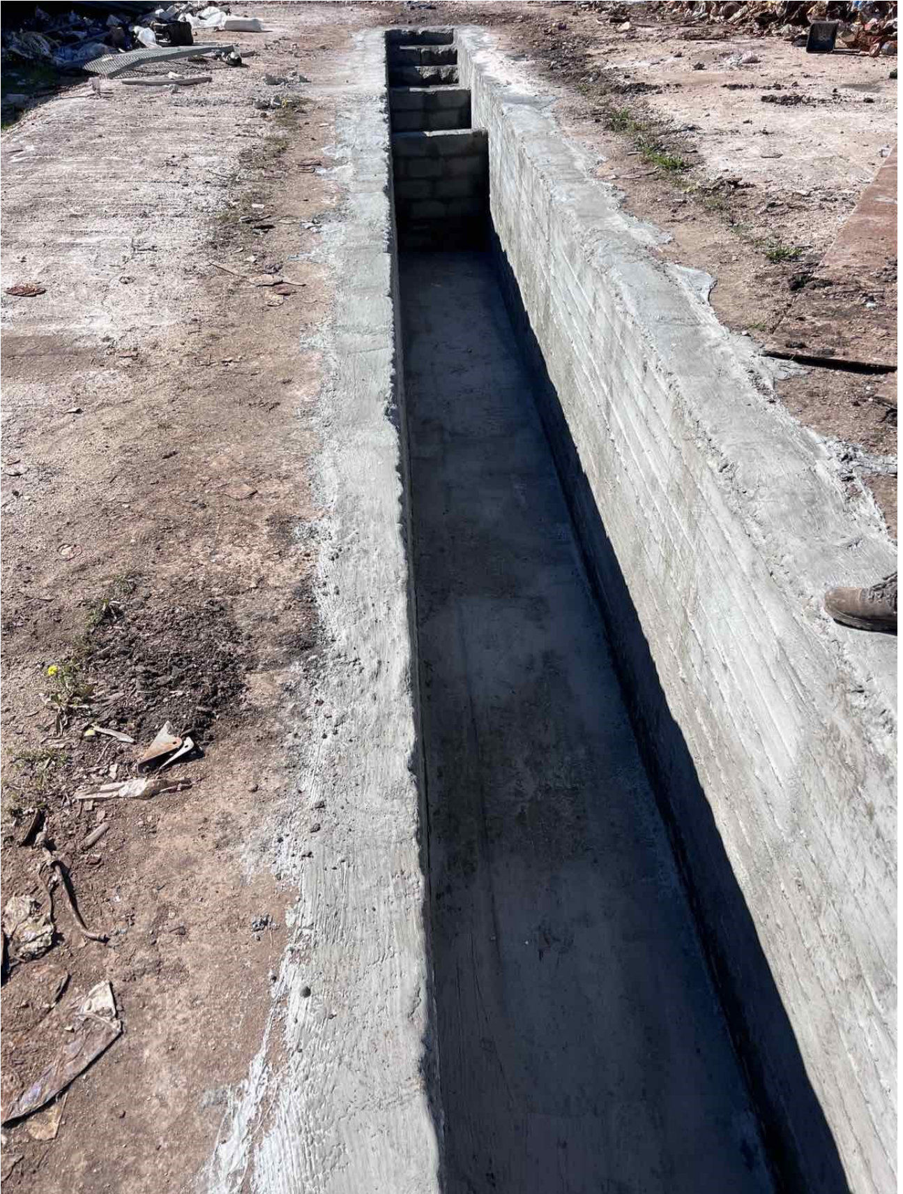
Φωτογραφία 3-4-5-6: Διαμόρφωση ελαιοδιαχωριστή