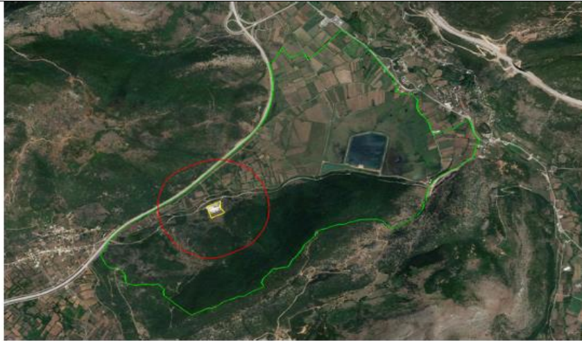
Θέση του έργου (κίτρινο πολύγωνο) και ΠΕΠ (κόκκινο πολύγωνο) ως προς την Περιοχή Μελέτης ΕΖΔ «Λίμνη Λιμνοπούλα» με κωδικό GR2120003 (πράσινο πολύγωνο)

Οι βοηθητικές εγκαταστάσεις για την εξυπηρέτηση των λειτουργικών αναγκών της επιχείρησης και προσωπικού είναι: