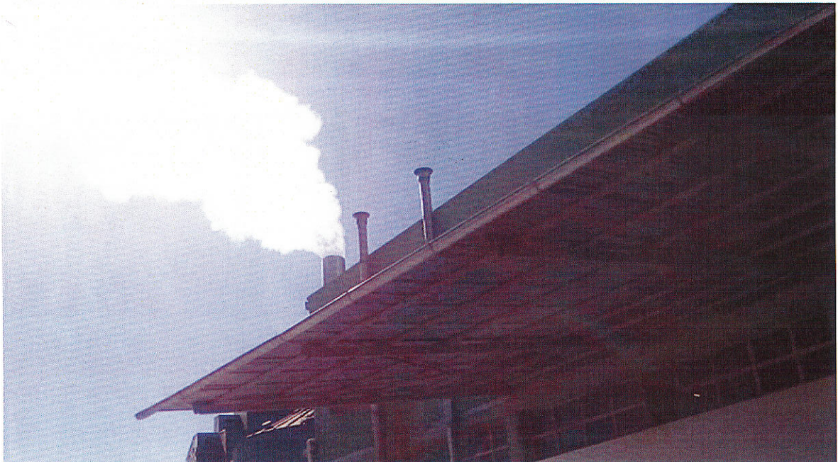
Εικ.4 Έξοδος περίσσιας ατμού