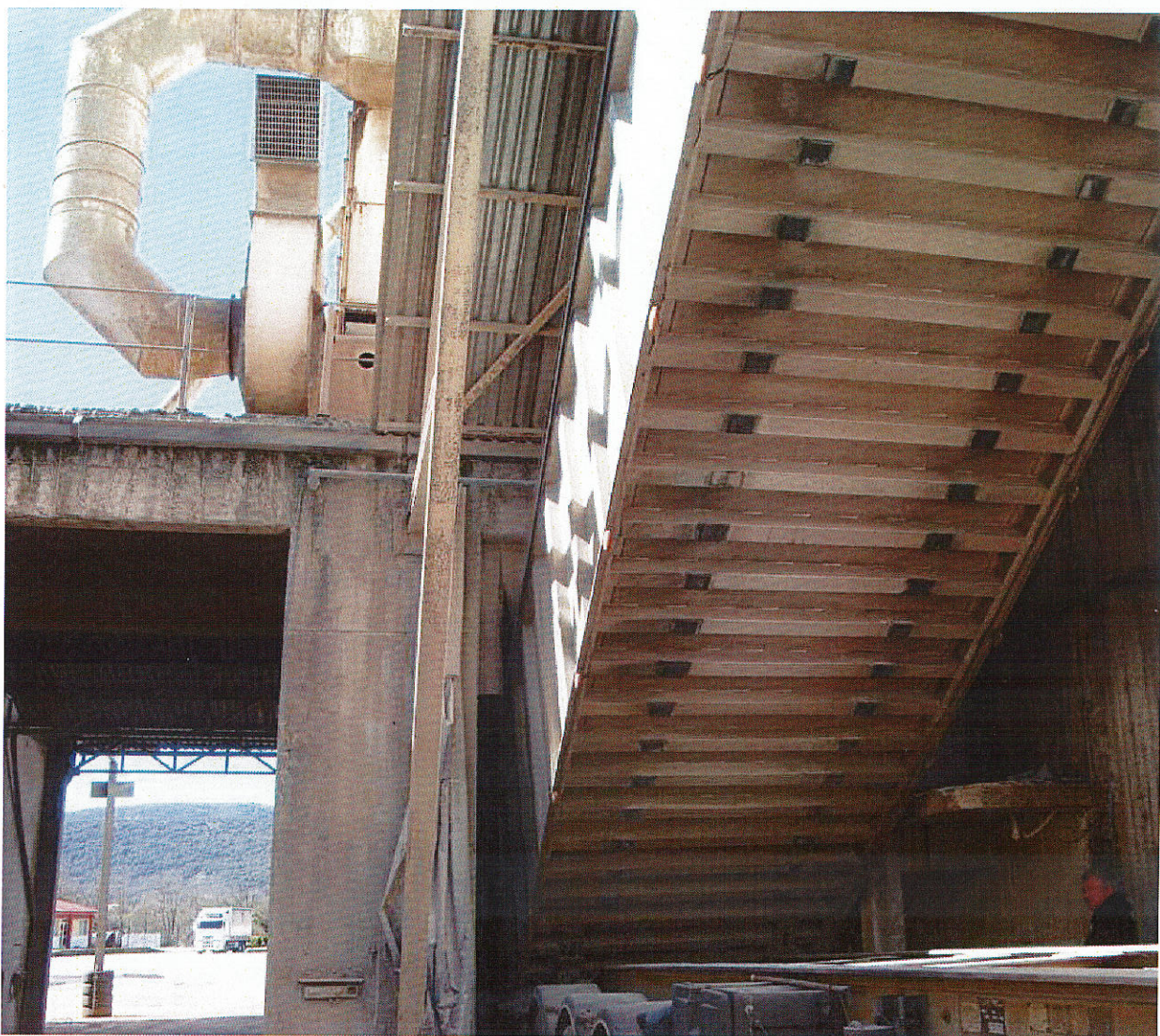
Εικ.1 Χώρος παραλαβής πρώτων υλών