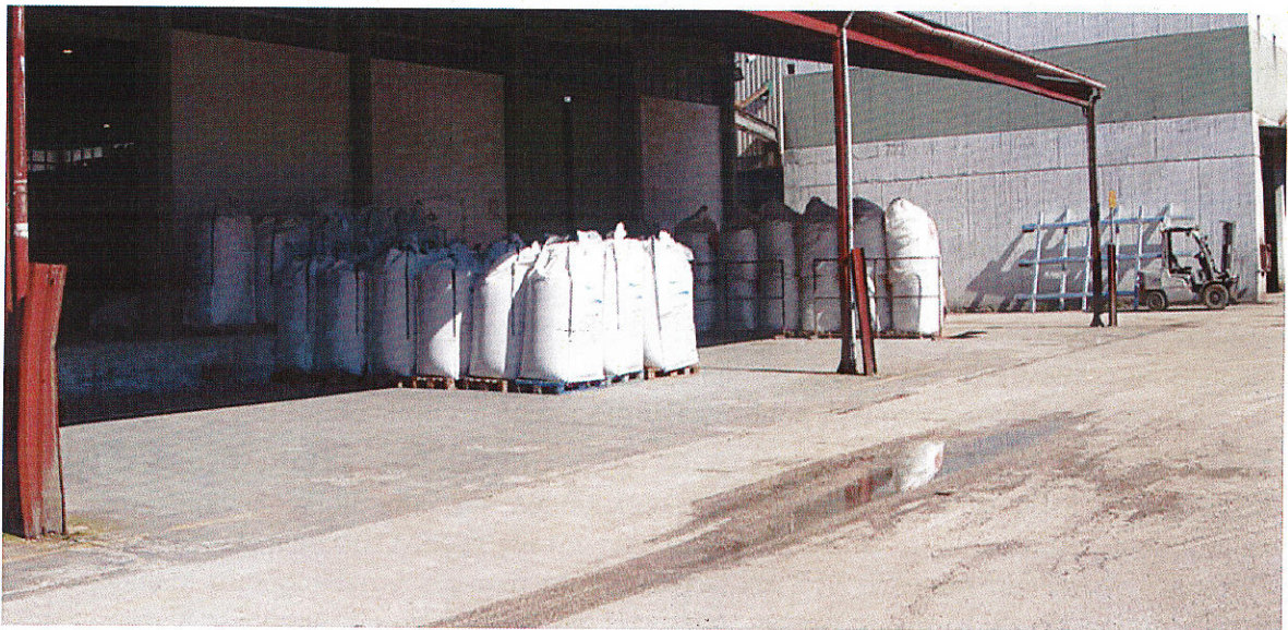
Εικ.6 Περιβάλλον χώρος δραστηριότητας