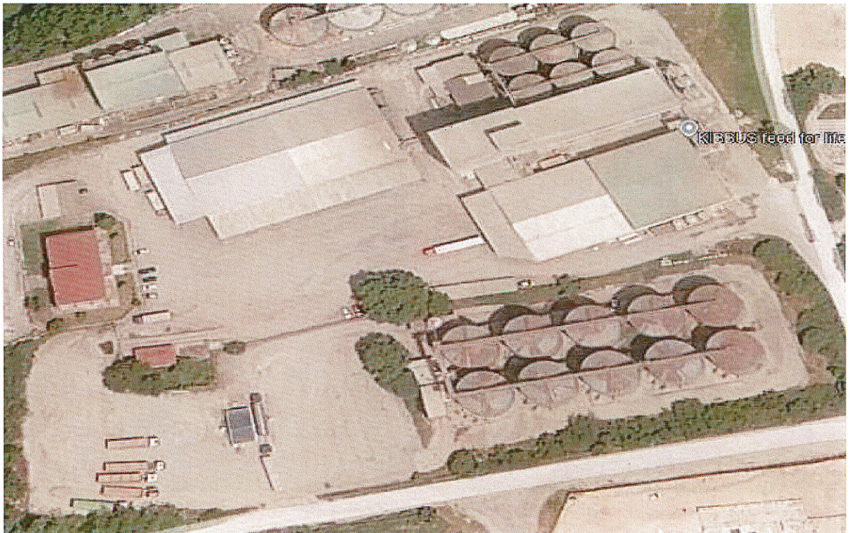
Εικ.1: Θέση της δραστηριότητα ΘΕΟΔ. ΚΑΝΤΖΑΣ Α.Ε.

Ο περιβάλλον χώρος της δραστηριότητας ήταν καθαρός.