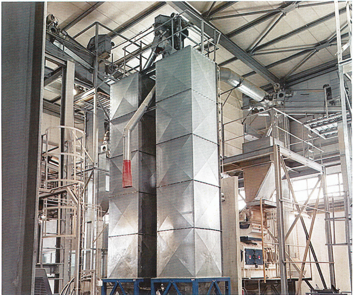
Εικ.3 Κυκλώνας για κατακράτηση σκόνης