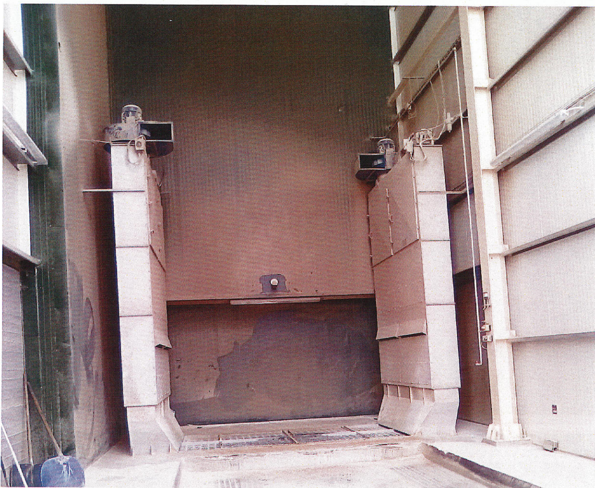
Εικ.1 Χώρος παραλαβής πρώτων υλών με εγκατεστημένα συστήματα αναρρόφησης σκόνης