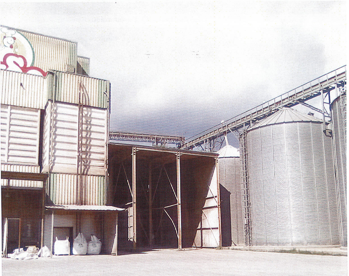
Εικ.8 Περιβάλλον χώρος δραστηριότητας σιλό αποθήκευσης πρώτων υλών