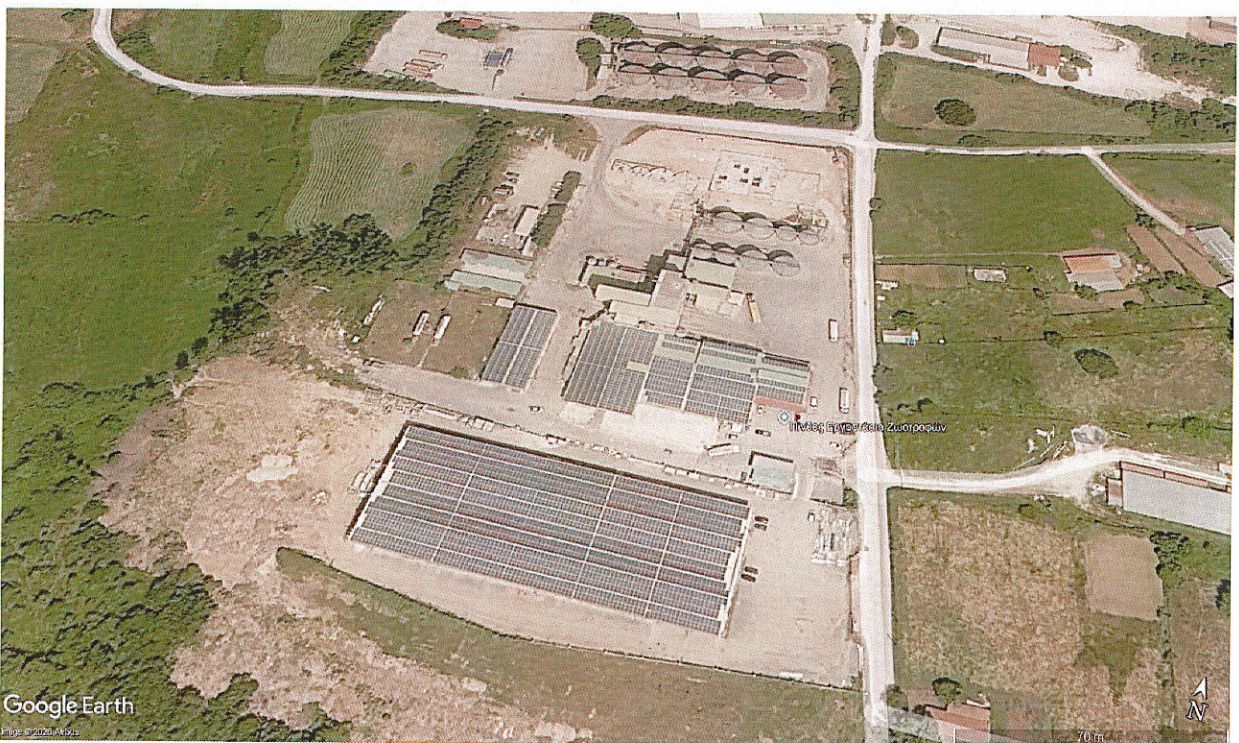
Εικ.1: Θέση της δραστηριότητας Αγροτικός Πτηνοτροφικός Συνεταιρισμός Ιωαννίνων «Η ΠΙΝΔΟΣ»