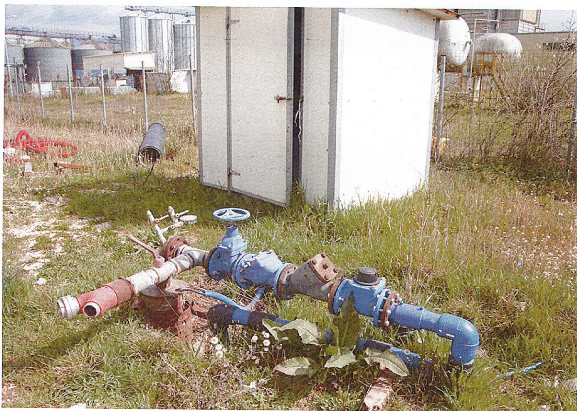
Εικ.6 Γεώτρηση υδροδότησης της δραστηριότητας