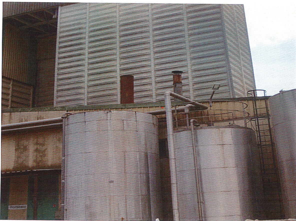
Εικ.5 Καπνοδόχοι λεβητοστασίου