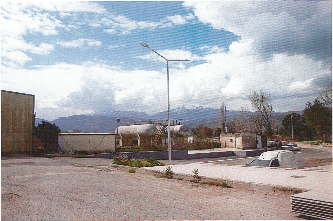
Εικ.7 Περιβάλλον χώρος δραστηριότητας