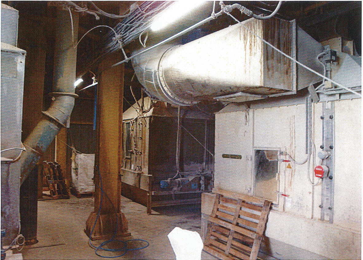
Εικ.3 Διάταξη για κατακράτηση σκόνης στην παραγωγική διαδικασία