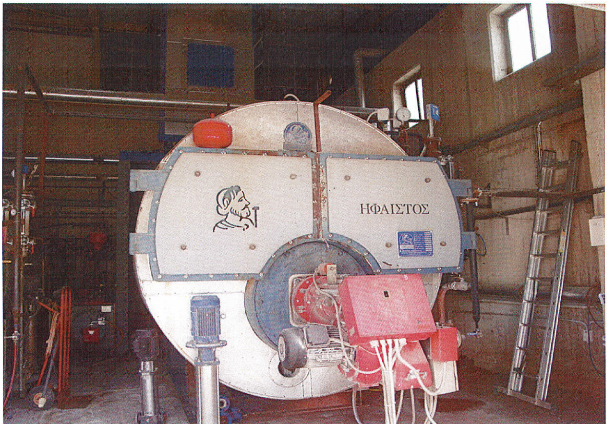
Εικ.4 Νέος ατμολέβητας υγραερίου